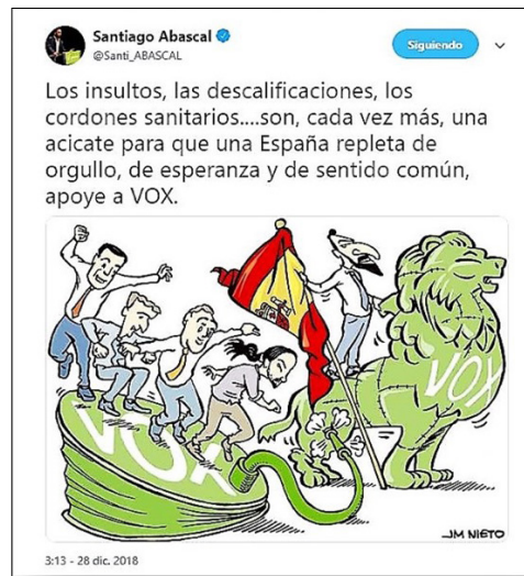
Figura 7. Captura de un tuit sobre referencias negativas hacia Vox

en general, agitación en toda la audiencia digital. Si 9.000 personas asistieron a Vistalegre, posteriormente, un total de 288.000 personas llegaron a expresarse a través de Twitter sobre el acto, acumulando un total de 942.000 tuits sobre Vox (Caballero, 2018). La ira y la excitación son las dos emociones que más invitan a actuar por lo que fueran comentarios negativos o positivos, un millón de personas hablaron sobre un acto de un partido sin representación durante los días posteriores. El tuit de Santiago Abascal en el que se incluye una ilustración de José María Nieto confirma elocuentemente que Vox sabe que las campañas negativas favorecen su éxito.