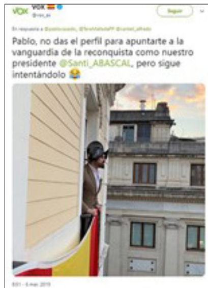
Figura 6. Tuit de Vox con referencia a la Reconquista española

Épica nacionalista. Vox, como defensor de la idea de España, recurre a la Hispanidad y al período de la Reconquista como metáfora de la lucha por cambiar el establishment actual. Asimismo, la idea de defensa nacional se retroalimenta con la búsqueda de un enemigo interno (procés catalán, autonomías, el “marxismo cultural” ...) y otro externo (burocracia de la UE, inmigración, islam...).