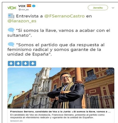
Figura 2. Captura del tuit de Abascal más retuiteado