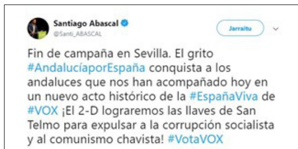
Figura 3. Captura de tuit sobre el final de campaña en Sevilla

Como conclusión se puede decir que los hastags y los tuits en los que van incluidos realizan una función de encuadre y refuerzan el mensaje y el discurso de Vox donde la apelación a las emociones, el uso de símbolos, la identificación del resto de partidos con los problemas actuales y la necesidad de un cambio radical son un recurso habitual.