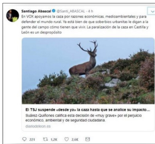
Figura 5. Captura de un tuit sobre la defensa de la caza

Lo rural frente a lo urbano. La imagen del ámbito rural con sus connotaciones (religión, costumbres...) en detrimento de lo urbano (cosmopolita, progresismo...) ha sido una constante en el mensaje de Vox durante el último año y aparece reiteradamente en los tuits analizados. Es clarificador el apoyo que la formación da a la caza, a los toros y a ciertas tradiciones (tanto culturales como religiosas). Sirvan de prueba las medidas de Vox recogidas en su programa en sus números 66 y 67 que se refieren a la protección de la tauromaquia, o el número 68 sobre la Caza (Vox, 2018).